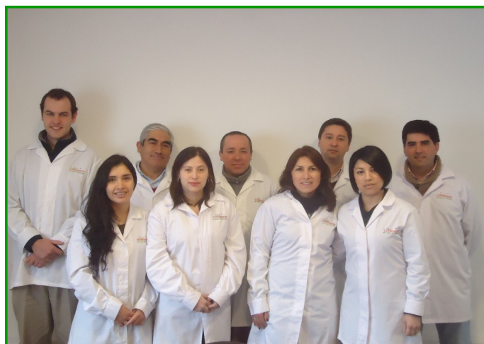
Equipo San Clemente Foods S.A.

Desde el año 2012 que la Planta de Deshidratados está certificada BRC, mientras que la Planta de Jugos, desde abril de 2013.